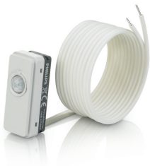
LRM8119/00 Lum Based Ext Sensor with LCA8004/00 COVER