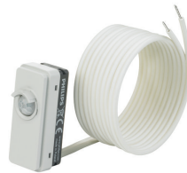
LRM8119/00 Lum Based Ext Sensor with LCA8004/00 COVER