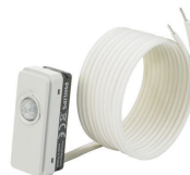
LRM8119/00 Lum Based Ext Sensor with LCA8004/00 COVER