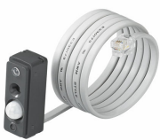
LR11663/00 ActiLume gen2 Multi-Sensor