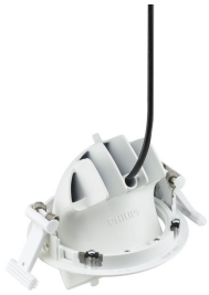
RS772B LuxSpace Accent Compact Elbow Back View