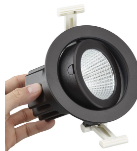
PerfectAccent reflector and front glass maintenance and upgrading is easy with an integrated button