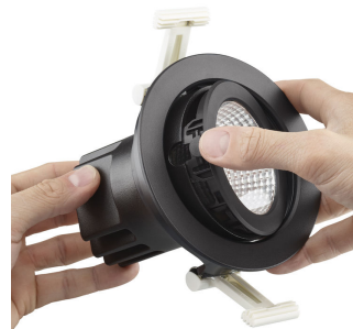
Step1: Press the button to unlock the front face