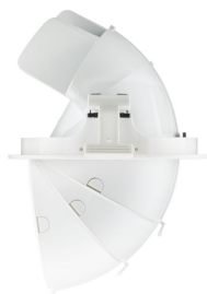
LuxSpace Accent Elbow luminaires offer great aiming flexibility