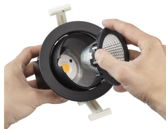
Step2: Remove the optical assembly from the luminaire