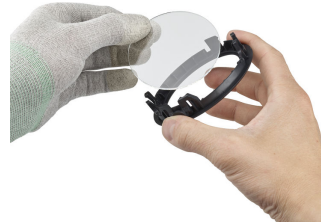
Step5 (optional): Add or remove the front glass