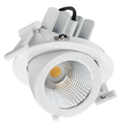
RS772B LuxSpace Accent Compact Elbow White