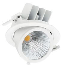
RS782B LuxSpace Accent Performance Elbow White