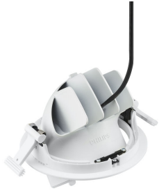
RS782B LuxSpace Accent Performance Elbow Back View