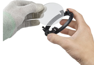
Step5 (optional): Add or remove the front glass