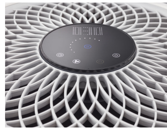
UVCA200 UV-C Floor standing air unit