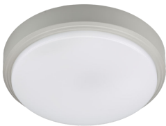
CoreLine Wall-mounted WL140V Ceiling-mounted Grey