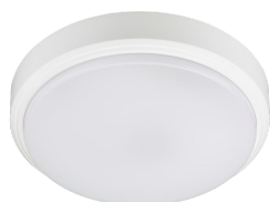
CoreLine Wall-mounted WL140V Ceiling-mounted