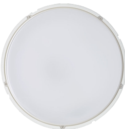
Coreline Wall-mounted WL140V Top View (with screw locations)