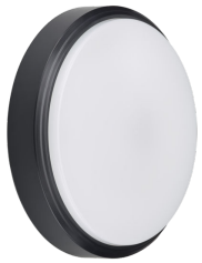
CoreLine Wall-mounted WL140V Wall-mounted Black