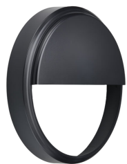
CoreLine Wall-mounted WL140V Half-moon Accessory Black