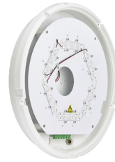
CoreLine Wall-mounted WL140V Wall-mounted PSU