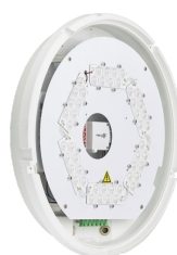
CoreLine Wall-mounted WL140V Wall-mounted PSR MDU