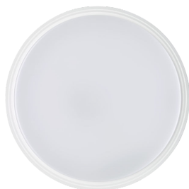
Coreline Wall-mounted WL140V Top View