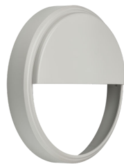
CoreLine Wall-mounted WL140V Half-moon Accessory Grey