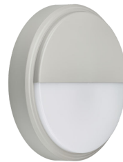
CoreLine Wall-mounted WL140V Wall-mounted Grey with Half- moon Accessory