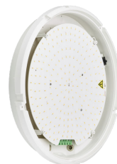
CoreLine Wall-mounted WL140V Wall-mounted Switchable Lumen & CCT