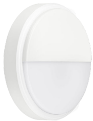
CoreLine Wall-mounted WL140V Wall-mounted White with Half- moon Accessory