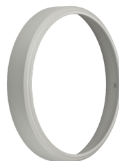
CoreLine Wall-mounted WL140V Rim Grey