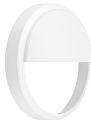
CoreLine Wall-mounted WL140V Half-moon Accessory White