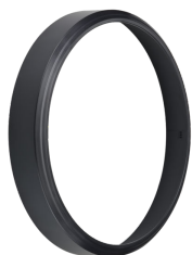
CoreLine Wall-mounted WL140V Rim Black