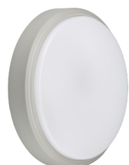
CoreLine Wall-mounted WL140V Wall-mounted Grey