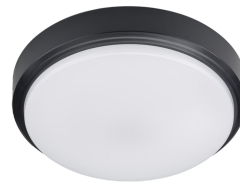
CoreLine Wall-mounted WL140V Ceiling-mounted Black